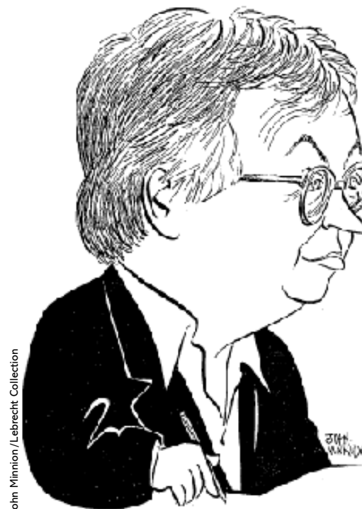
John Minnion/Lebrecht Collection