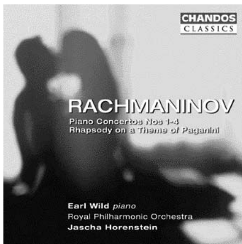
Rachmaninov Piano Concertos Nos 1-4 Rhapsody on a Theme of Paganini CHAN X10078

You can now purchase Chandos CDs directly from us. For further details please telephone +44 (0) 1206 225225 for Chandos Direct. Fax: +44 (0) 1206 225201. Chandos Records Ltd, Chandos House, Commerce Way, Colchester, Essex CO2 8HQ, UK E-mail: chandosdirect@chandos.net Website: www.chandos.net