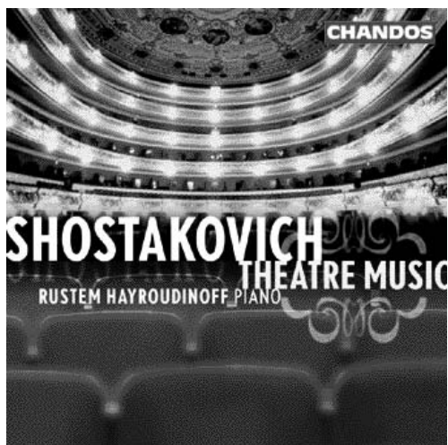
Shostakovich Theatre Music CHAN 9907