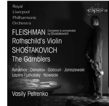
AV2121 (2CD set) VENIAMIN FLEISHMAN (completed Shostakovich) Rothschild's Violin DMITRI SHOSTAKOVICH The Gamblers