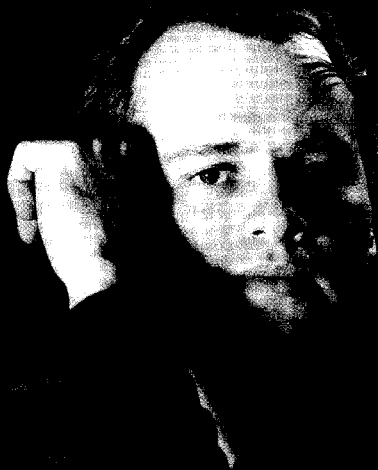
Torleif Thedéen, cello