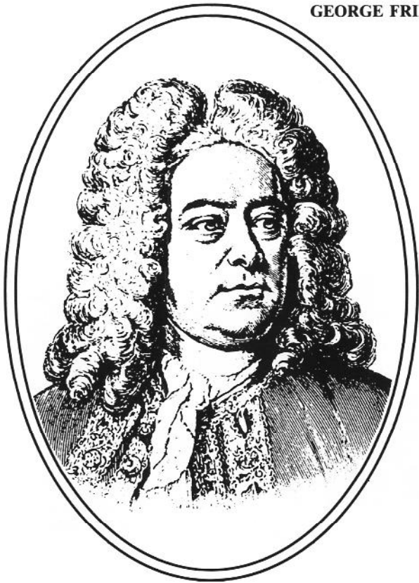
GEORGE FRIDERIC HANDEL

“Aucun noble en Angleterre et très peu d’autres en Europe mènent un train de vie d’une splendeur, d’une magnificence et d’une noblesse égales à celui du duc de Chandos”, écrivit Daniel Defoe en 1725 dans son monumental Périple travers toute l’Ile de Grande-Bretagne . James Brydges (1674-1744), duc de Carnarvon et fait premier duc de Chandos en 1719, s’enrichit en tant que trésorier-payeur des forces anglaises stationnées à l’étranger pendant les guerres de la succession d’Espagne qui secouèrent l’Europe durant la première décennie du dix-huitième siècle. Ayant mis de côté un minimum de six cents mille livres, il put faire reconstruire la résidence de Cannons qu’il venait d’acquérir au nord-ouest de Londres dans un style palladien extravagant. Vanbrugh, William Talman, John James et James Gibbs furent tour à tour responsables de l’architecture, et plusieurs des peintres-décorateurs les plus illustres de l’époque participèrent à la restauration de l’habitation principale et de l’église voisine de St Lawrence (où les Chandos Anthems furent donnés pour la première fois) que Brydges fréquenta jusqu’à l’inauguration de sa magnifique chapelle en 1720.