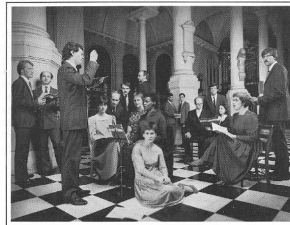
THE SIXTEEN CHOIR