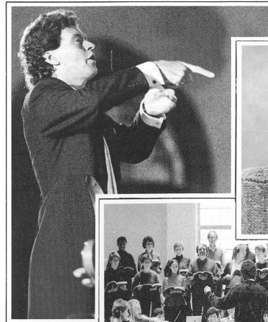
HARRY CHRISTOPHERS Conductor