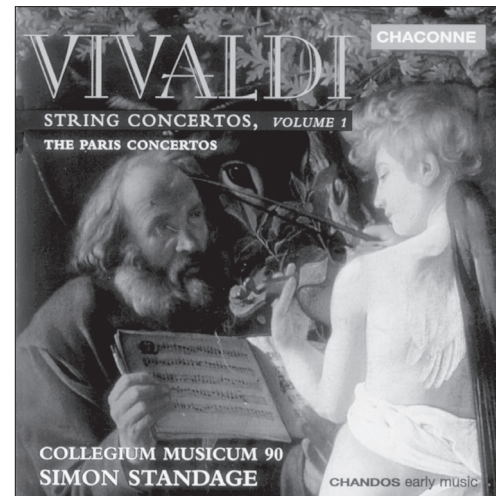
Vivaldi String Concertos, Volume 1: The Paris Concertos CHAN 0647