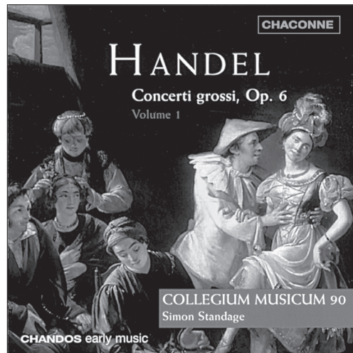
Handel Concerti grossi, Op. 6, Volume 1 CHAN 0600