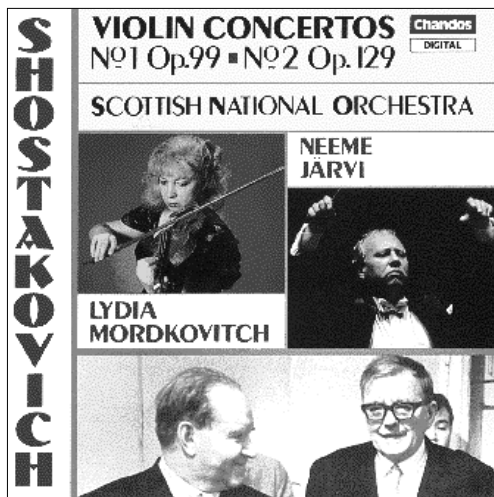
Shostakovich Violin Concerto No. 1, Op. 99 Violin Concerto No. 2, Op. 129 CHAN 8820