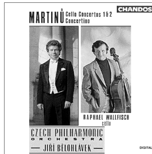
Martinů Cello Concerto No. 1 Cello Concerto No. 2 Concertino for Cello, Wind Instruments, Piano and Percussion CHAN 9015