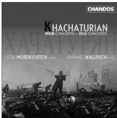
Khachaturian Violin Concerto Cello Concerto CHAN 9866

You can now purchase Chandos CDs directly from us. For further details please telephone +44 (0) 1206 225225 for Chandos Direct. Fax: +44 (0) 1206 225201. Chandos Records Ltd, Chandos House, Commerce Way, Colchester, Essex CO2 8HQ, UK E-mail: chandosdirect@chandos.net Website: www.chandos.net