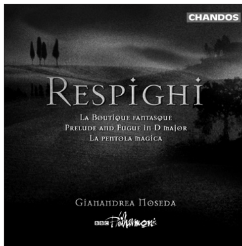
Respighi La Boutique fantasque • Prelude and Fugue in D major • La pentola magica CHAN 10081