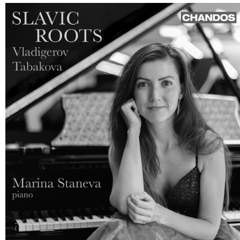
Slavic Roots CHAN 20251