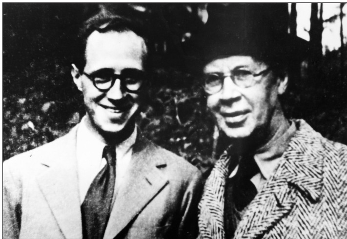
Sergey Sergeyevich Prokofiev (r.) with Mstislav Rostropovich