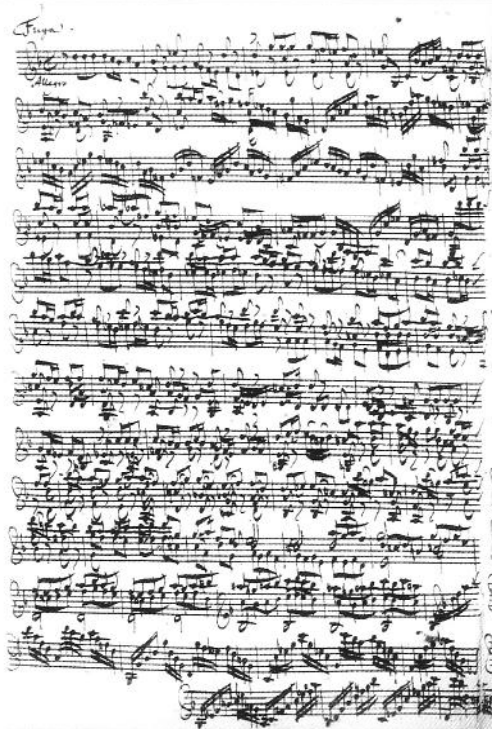
Autograph page of the Manuscript of Bach's Sonata for Violin in G minor, courtesy of the Staatsbibliothek Preussischer Kulturbesitz, Berlin.