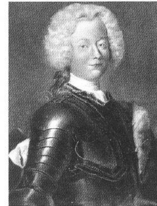
Archiv für Kunst und Geschichte