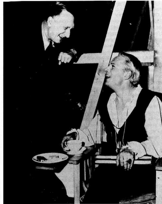
Walton and Olivier on the set of Hamlet