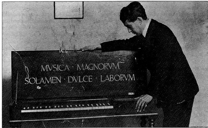
Herbert Howells at the clavichord of Herbert Lambert

H ERBERT HOWELLS war ein Komponist, der sich in erster Linie mit Vokalmusik befasste, und das Klavier mit seiner relativ begrenzten Fähigkeit zum vokalen cantabile gehörte daher nicht zu seinen bevorzugten Instrumenten. Doch da Howells von seinem Lehrer Stanford, der ihn in allen Bereichen seiner Kunst unterwies, auch eine gründliche Ausbildung auf dem Gebiet der Tasteninstrumente erhalten hatte, beherrschte er das Klavier völlig — sowohl als Komponist als auch als Ausführender — und Howells Kompositionen für das Instrument teilen die seinem gesamten Werk eigenen Qualitäten von Charme und Vornehmheit.