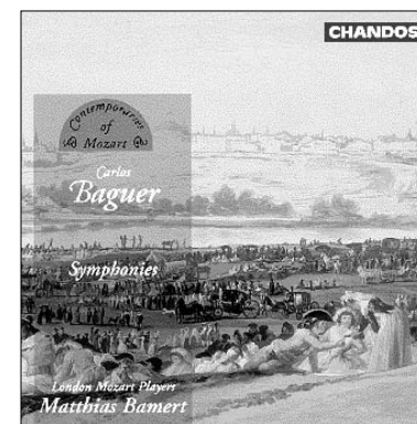
Carlos Baguer Symphonies CHAN 9456