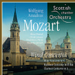
CLARINET CONCERTO IN A with the SCO (CKD 273)