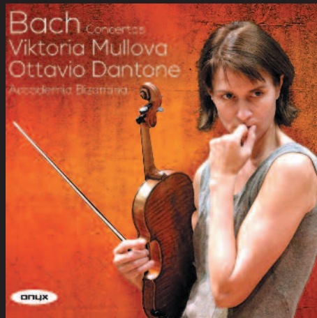
ONYX 4114 BACH: CONCERTOS VIKTORIA MULLOVA · OTTAVIO DANTONE