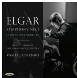
ONYX 4145 Elgar: Symphony No.1 Cockaigne Overture Royal Liverpool Philharmonic Orchestra Vasily Petrenko