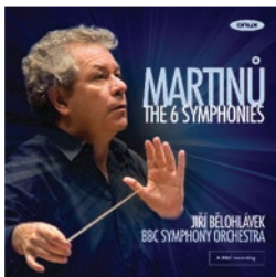
ONYX 4061 Martinů: The 6 Symphonies BBC Symphony Orchestra Jiří Bělohlávek