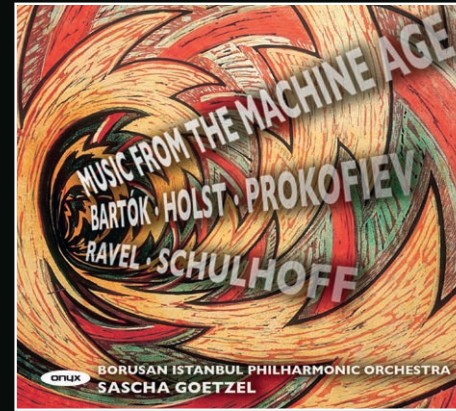
ONYX 4086 Music from the Machine Age: Bartók · Holst · Schulhoff · Ravel · Prokofiev BIPO · Sascha Goetzel