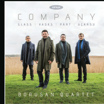
ONYX 4171 'Company' – Glass: String Quartet No.2, Pärt: Summa, Uçarsu: String Quartet No.2 'The Untold', Vasks: String Quartet No.4 Borusan Quartet